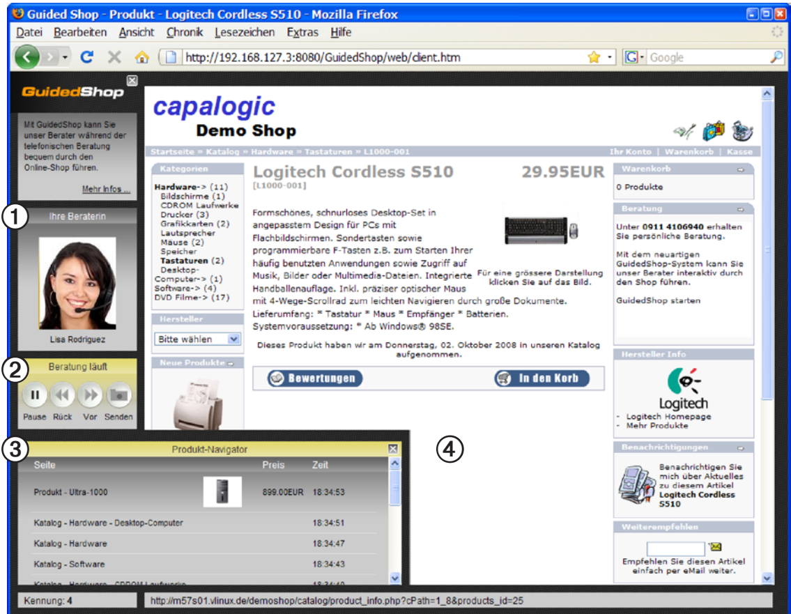
Screenshot von GuidedShop (Stand Oktober 2008)